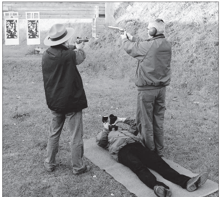
Viel Aufwand für gute Bilder. Playboy-Fotograf Carsten Koall blitzt von unten gegen die aufgehende Sonne.